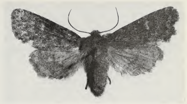
Dasyptolia templi (Thunberg), ♀, Rotterdam-Lombardijen, × 1½.

exemplaar op 26.vi.1970. Inderdaad een zwerver zoals Lempke (1964) veronderstelt?