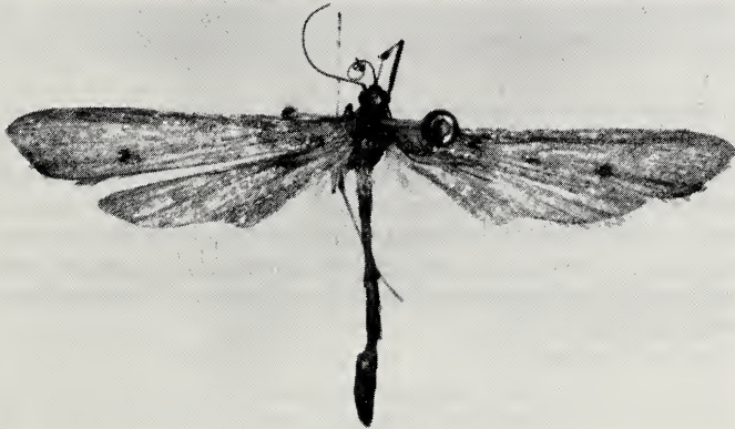
Fig. 4. Agdistis arenbergeri sp. n., male holotype.

Remarks: In the collection of the British Museum (Natural History) I found a specimen from Natal, Kimbolton, Estcourt, (Brit. Mus. slide 2200), identified as Agdistis pustulalis Walker, 1864. The genitalia of this specimen appeared identical to those of the specimen from Bloemfontein depicted in figs 1-3. I was not in the position to examine the type-specimen of Agdistis pustulalis .