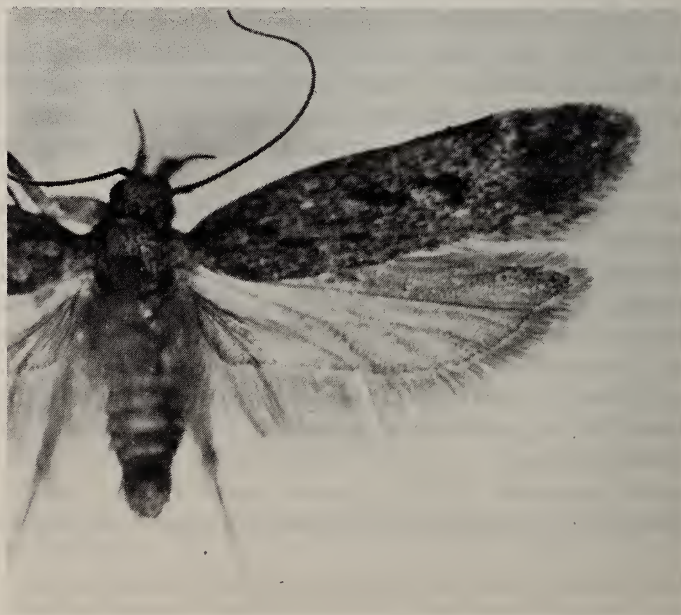
Fig. 1. Gelechia rhombelliformis , Best, 9.VIII.1976, ♂.

Bucculatrix cristatella Zeller. — Deze soort onderscheidt zich van andere Bucculatrix -soorten door de geringe grootte (spanwijdte 7 mm) en de eenkleurig grijsgele voorvleugels. Ik ving de vlindertjes midden mei en einde juli-begin augustus 1980 (twee generaties) boven de voedselplant Duizendblad ( Achillea millefolium L.) op een ruderaalterrein in Best. Afbeeldingen van vlinders en genitaliën zijn te vinden in het artikel over de Scandinavische Bucculatrix -soorten van Svensson (1971). De soort komt in alle ons omringende landen voor.