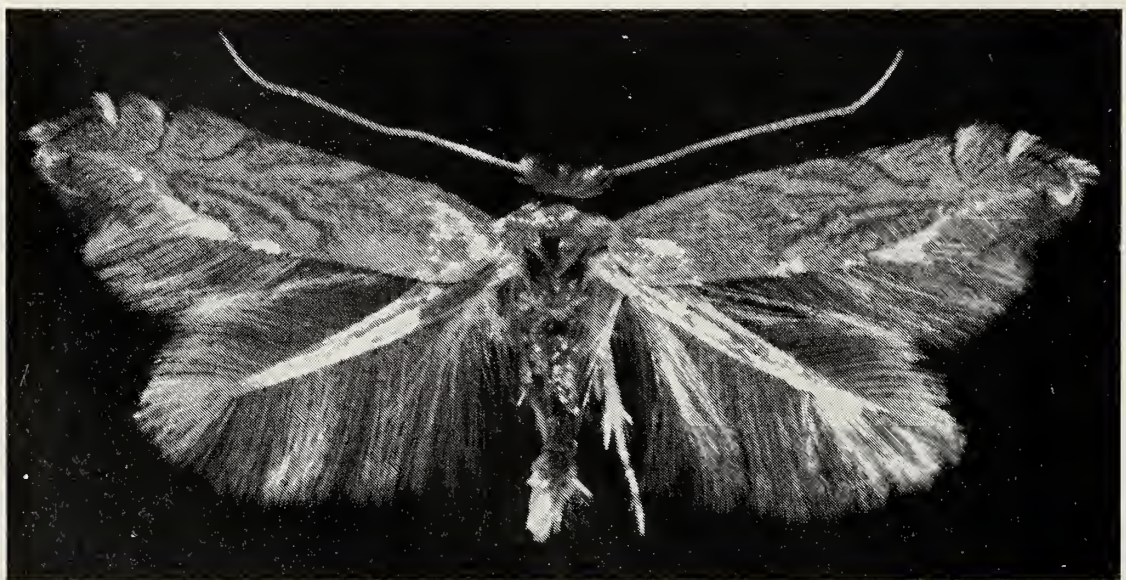
Abb. 1. Phyllonorycter trojana sp. n. ♂ Aus der Paratypenserie. Daten im Text.

Die vorliegende Beschreibung basiert auf einer Serie von Minen, die im Herbst 1978 vom Autor in Mazedonien gesammelt wurden. Die Imagines schlüpften im folgenden Frühjahr. Neben den Imagines wurden auch Exuvien präpariert und die Minen in einem Minenherbar konserviert. Die für die Beschreibung verwendeten Genitalien wurden in Kalilauge mazeriert, mit Mercurochrom oder Chlorazol gefärbt, über eine Äthanolreihe in Methylbenzoat, Xylol und schließlich in Euparal essenz übergeführt. Die Einbettung erfolgte in Euparal. Das männliche Genitale wurde so gebreitet, daß dessen Innenseite dargestellt werden konnte. Aus allen Präparaten wurde der Darm entfernt. Die Exuvien wurden analog behandelt, um im Lichtmikroskop untersucht zu werden.