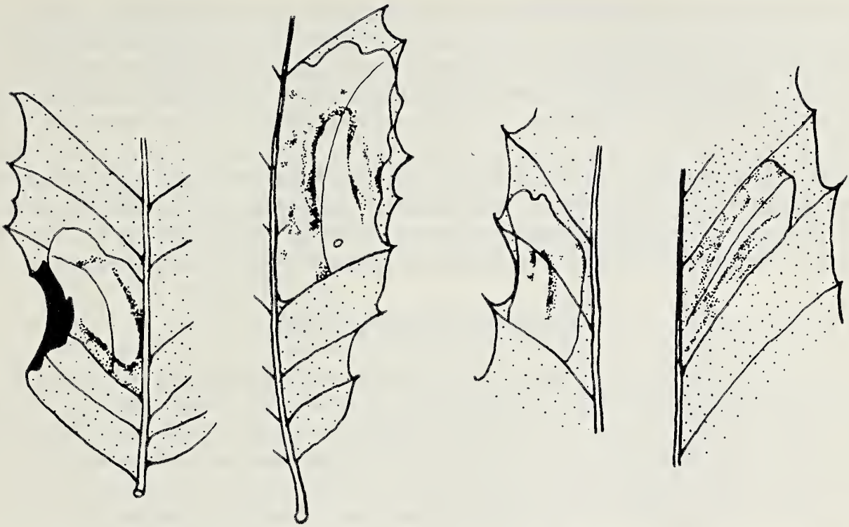
Abb. 8. Phyllonorycter trojana sp. n. Aus der Paratypenserie. Minen in Quercus trojana Webb. Unterseite der Blattausschnitte.

Fortsatz von halber Valvenlänge. Die Valven kurz und schmal, jedoch kräftig sklerotisiert. Die Valvenbasis (etwa das proximale Drittel) ist durch eine kräftige, segelförmige, stark sklerotisierte Haut mit dem dorsalen Tegumen verbunden. Valvenbasis etwas eingeschnürt, dann keulenförmig verdickt und an der Spitze wieder verjüngt und gerundet. Innenseite der Valven ab der Mitte immer dichter mit meist gegen die Spitze gerichteten kurzen Borsten schütter besetzt. Am Ventralrand von 1/4 bis um die Spitze einige kräftige, ventrokaudal gerichtete Borsten. Ebenso am Ventralrand bei 1/5 und an der Valvenspitze je ein kurzes, gebogenes, stumpfes Häkchen. Socii (Ventralseite des Uncus) dicht mit sehr feinen Borsten bedeckt, die unter der Stereolupe kaum erkennbar sind. Die Uncusspitze überragt die Valvenspitzen nur wenig. Der Aedoeagus ist gegen die Spitze ein wenig verjüngt; die carina penis ist ein kräftiger, cephal gerichteter Haken. Phallobasis kurz und am Ende kaum verbreitert. Lobus ventralis (processus des 9. Sternites) V-förmig gewinkelt und am Apex breit gerundet (Ventralansicht).