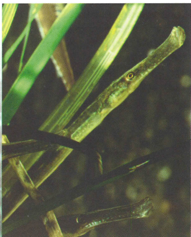
● Trompetterzeenaald ( Syngnathus typhle ).

Helaas is er de vorige winter ➤ (2001-2002) nauwelijks zeegras aangespoeld op Rügen. Toen kwamen we terecht op het eiland Laessø, aan de noordoostkust van Jutland, waar zeegras als dakbedekking wordt gebruikt. Wij gingen van de veronderstelling uit dat er veel zeegras in de omgeving voorhanden zou zijn. Maar helaas hadden de mensen daar dezelfde problemen als wij. Op de zuidkust van het eiland Funen in Denemarken en op de zuidkust van Zweden vonden we echter flinke hoeveelheden. We zijn nu bezig om toestemming te krijgen het te mogen ophalen, zodat we volgende zomer het project tot een goed einde kunnen brengen. Intussen heeft de Vereniging voor Agrarisch Natuur- en Landschapsbeheer De Lieuw op