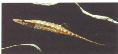
● Zeestekelbaars ( Spinachia spinachia ).

De afgelopen jaren was de Slechtvalk al een regelmatige verschijning bij de centrale. Vanaf september vorig jaar ging het om een paar. Het vrouwtje is ten zuiden van Brussel uit ei gekropen en aldaar van een ring voorzien. Het mannetje is mogelijk van Duitse origine. Begin