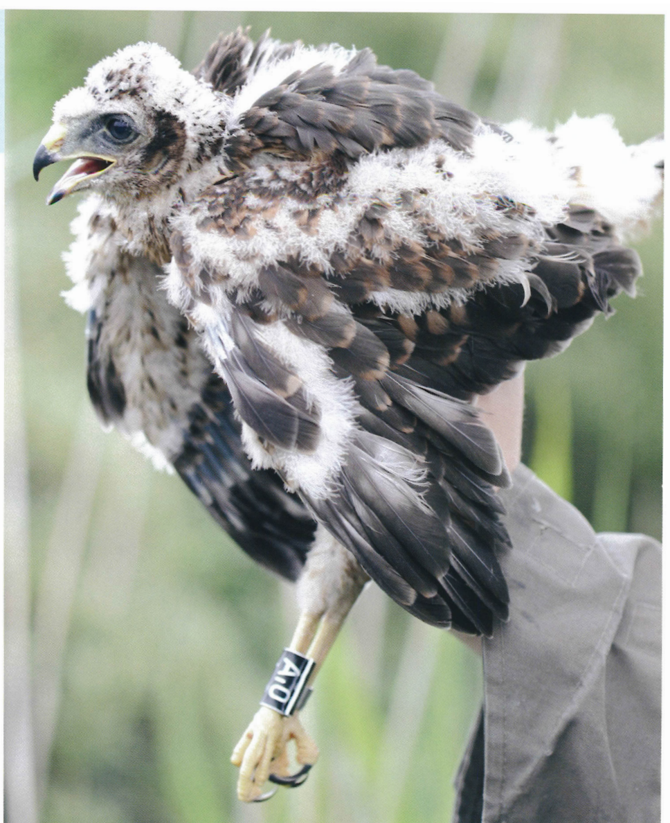
● Kuiken van blauwe kiekendief met kleurring.

Dit jaar heeft een paartje lachsterns gebroed op Balgzand. Dat was het eerste broedgeval in Nederland sinds 1958. De Noord-Europese populatie van deze stern is bijzonder klein, het gaat om hooguit enkele tientallen paren. Of er op Balgzand jongen zijn groot gebracht is onduidelijk. Medewerkers van Landschap Noord-Holland ontdekten de lachsterns op 26 mei tijdens een telling van de broedvogels. De lachsterns hadden op dat moment al een nest dat bestond uit gras en ander plantaardig materiaal. Het nest lag vlakbij een grote kolonie van meeuwen en sterns. Kennelijk zijn de vogels hier weggepest, want op 2 juni werden de vogels op een andere plaats broedend aangetroffen. Er werden toen ook een prooi-overdracht en een nestaflossing gezien. Tot 7 juli zijn de vogels waargenomen op Balgzand. Er is echter geen prooi-aanvoer naar het nest waargenomen, noch jonge lachsterns. Mogelijk is de broedpoging in de eifase mislukt. De lachstern is rond de Middellandse Zee nog een vrij algemene maar lokale broedvogel. De Noord-Europese populatie is echter bijna