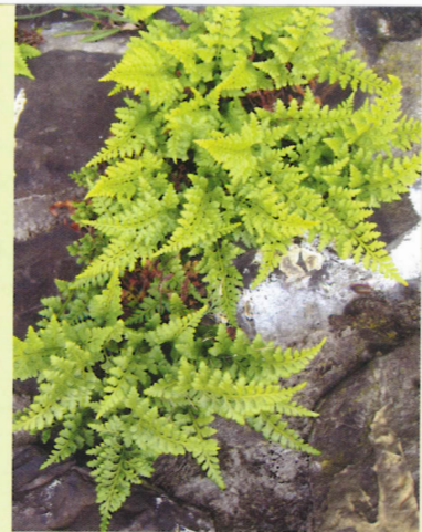
● Zwartsteel op een kademuur aan de Haarlemmertrekvaart.

De tongvaren is beschermd. In 2007 is een recordaantal van 2000 planten bereikt. Tongvaren profiteert van een reeks zachte winters. Vooral op de vaste groeiplaatsen heeft de soort zich kunnen uitbreiden (tot soms meer dan 100 planten), maar daarnaast zijn er her en der ook nieuwe, kleine populaties ontstaan. Tongvaren is, anders dan steenbreekvaren, vooral op de binnenstad aangevoelen. Dat maakt haar kwetsbaar. Door het intensieve onderhoudsregime van grachtmuren wordt de soort voortdurend bedreigd.