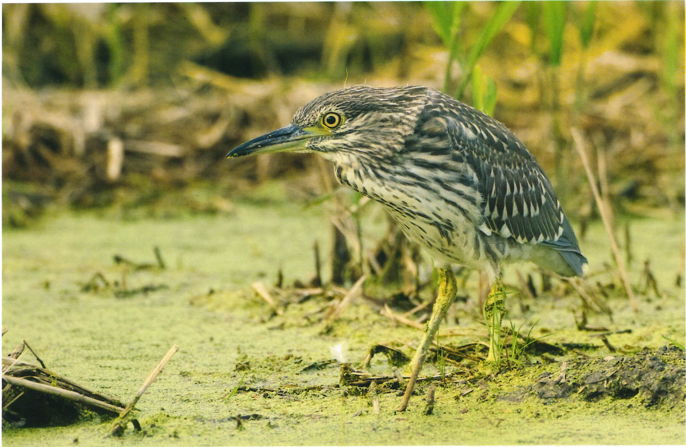
● Juveniele kwak.

men (N. Dijkstra). Een jaar later, op 9 mei 1989 vertoonde er zich weer één (E. Menkveld). Op 3 juni 1995 nam men een overvliegende vogel waar (R. Struijk en J. Wit) en op 18 en 19 juni 2000 verbleef een tweedejaars vogel twee dagen in het Reigerbos (beheermedewerkers Natuurmonumenten). Behoudens het geval van juni 2000 is het onbekend of het bij de waarnemingen in 1988, 1989 en 1995 om eerstejaars, tweedejaars of adulte vogels ging, maar feitelijk is dit niet zo belangrijk. Er waren andere tijden aangebroken en de vogels hadden deze keer hun bezoek aan het Zwanenwater overleefd. Uit het Kooibos is mij slechts één waarneming van een kwak bekend en wel van een juveniel exemplaar ter plaatse op 11 augustus 2005 (H. van den Heuvel). Uit de diverse ter beschikking staande bronnen wordt niet geheel duidelijk waar de vogel nu precies gevangen of geschoten is: het Zwanenwater of het Kooibos. Thijsse spreekt van het Zwanenwater.