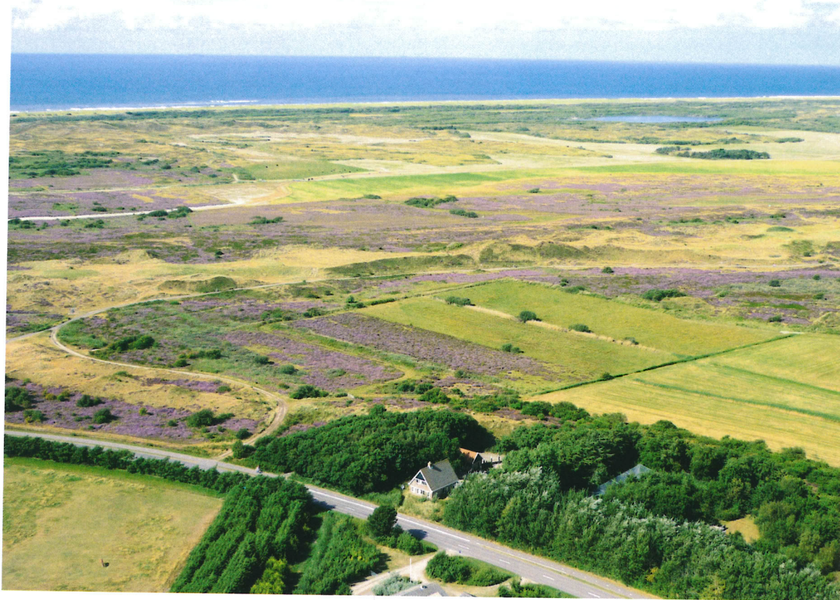
● Natuurherstel bij de Korverskooi op Texel.