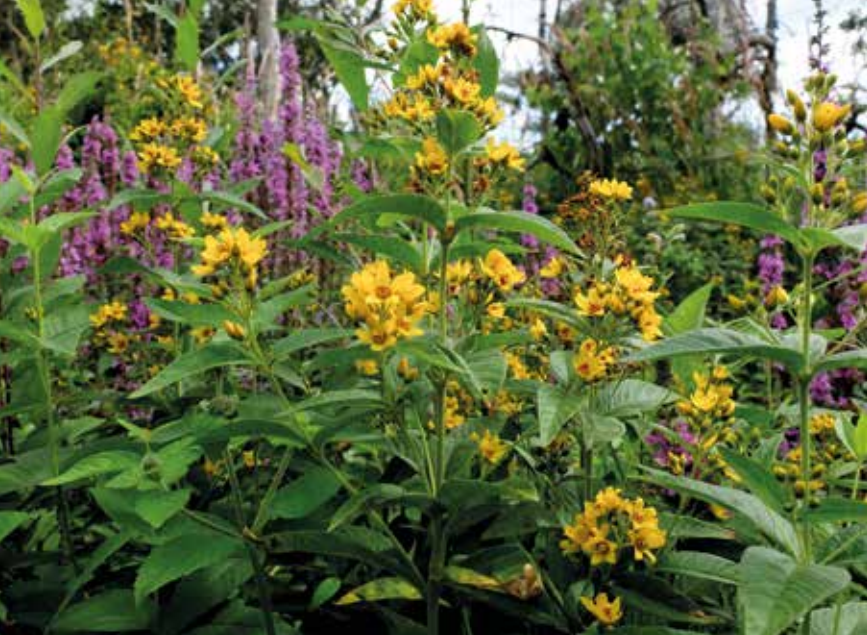
● Grote wederik met kattenstaart.