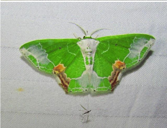
Links: Protulioenemis partita , Keerom, Papua, sept. 2019 (zie pag. 4)