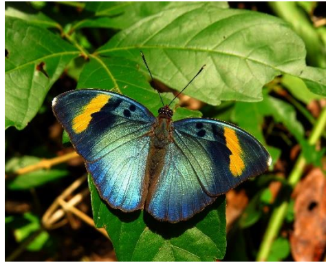
Euphaedra medon , Ghana, 2014. (zie pag. 9)