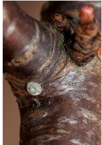
Boven: Eitje Sleedoornpage, Wolvega, excursie 16 febr. 2019. (zie pag. 16)