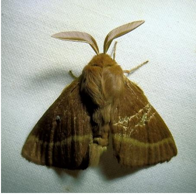
Kleine hageheld ( Lasiocampa trifolii ) (zie pag. 24)