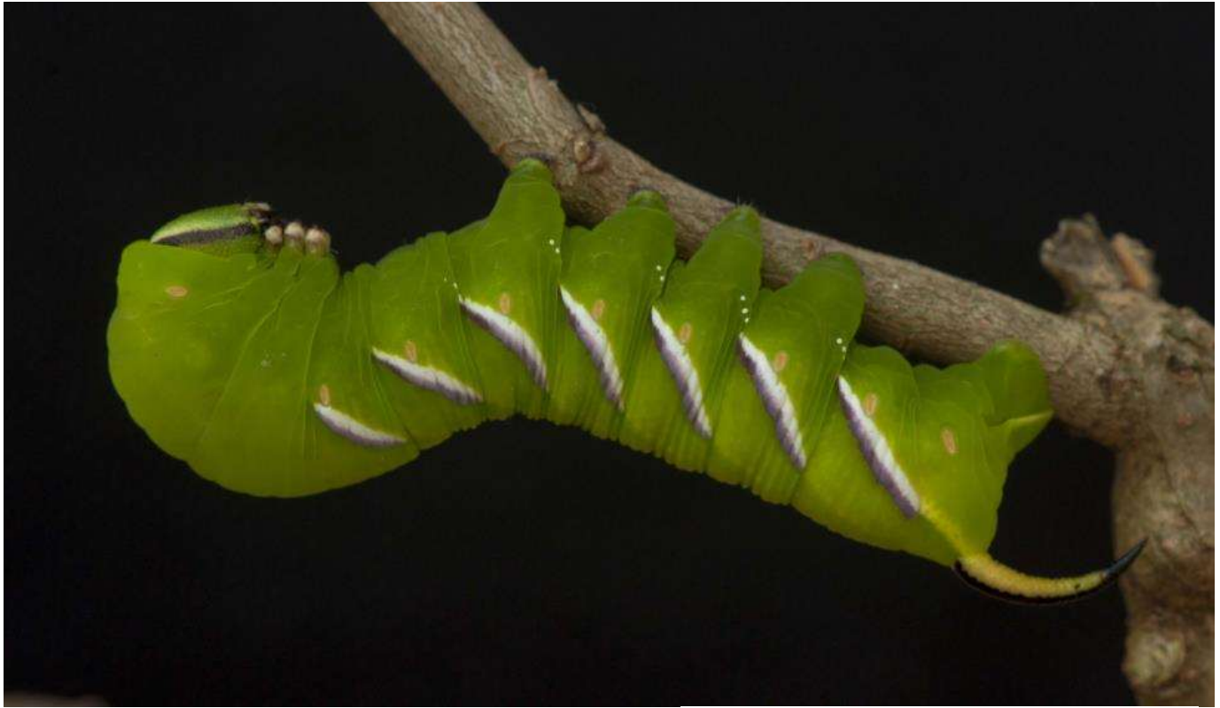
Ligusterpijlstaart ( Sphinx ligustri )