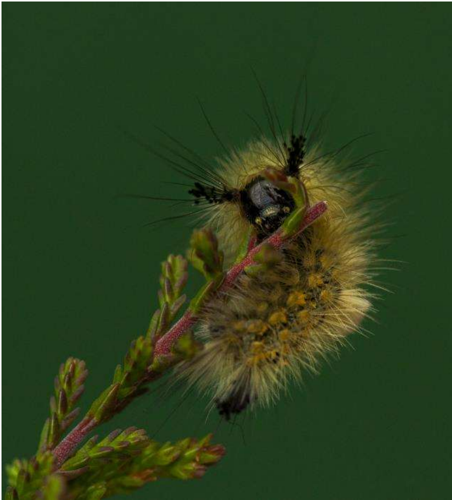
Rups Orgyia antiquoides (Heidewitvlakvlinder) (zie pag. 30)