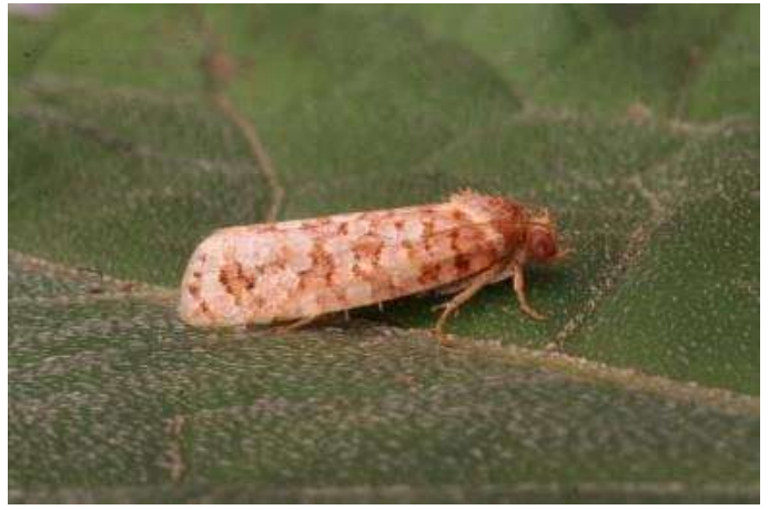
Lozotaeniodes formosana (stipjesbladroller) (zie pag. 29)