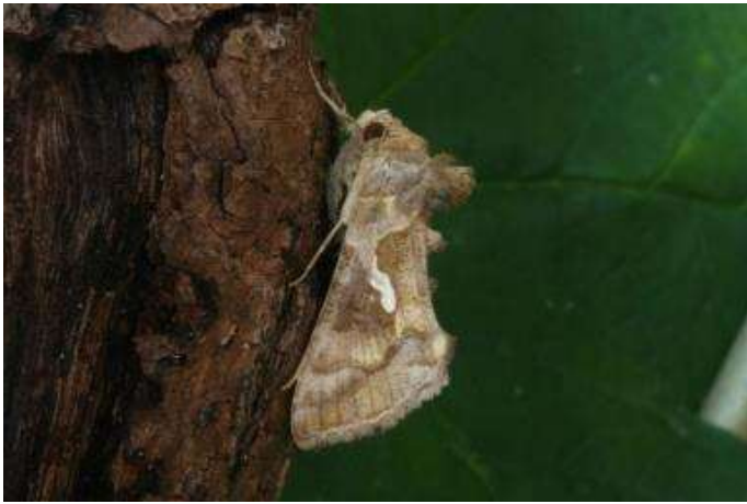
Chrysodeixis chalcites (turkse uil)(zie pag. 28)