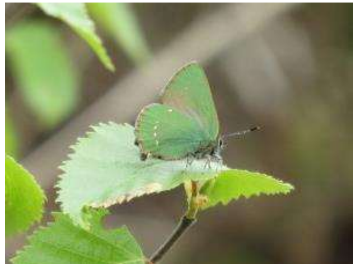
Groentje ( Callophrys rubi ), Hulstreed. zie blzd. 30.