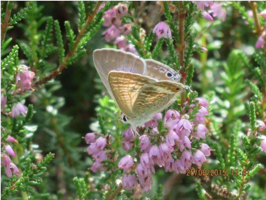
Tijgerblauwtje ( Lampides boeticus) Hulstreed, Hoornsterzwaag, 25-08-2015 Zie blzd.31.