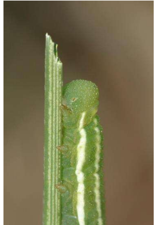
Veenhooibeestje (Coenonympha tullia) copula en rups, excursie Fochtelooërveen (zie pag. 28)