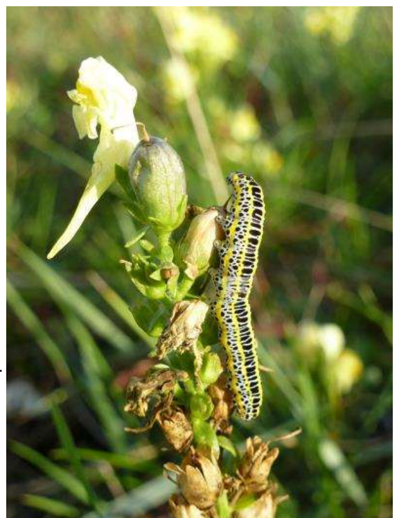
Rups van vlasbekuiltje (Calophasia lunula) Lauwersoog 29 augustus 2014