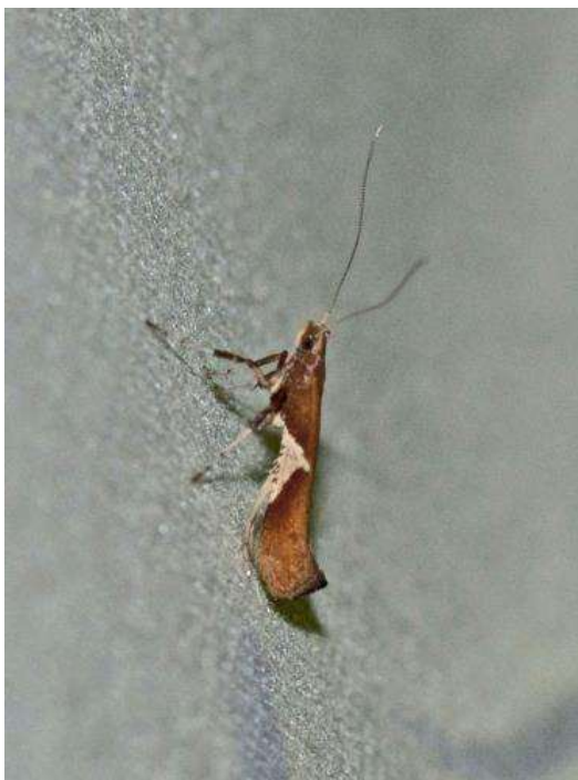
Wilgensteltnot (Caloptilia stigmatella) excursie Fochtelooërveen 27 september 2014 (zie pag. 21 )