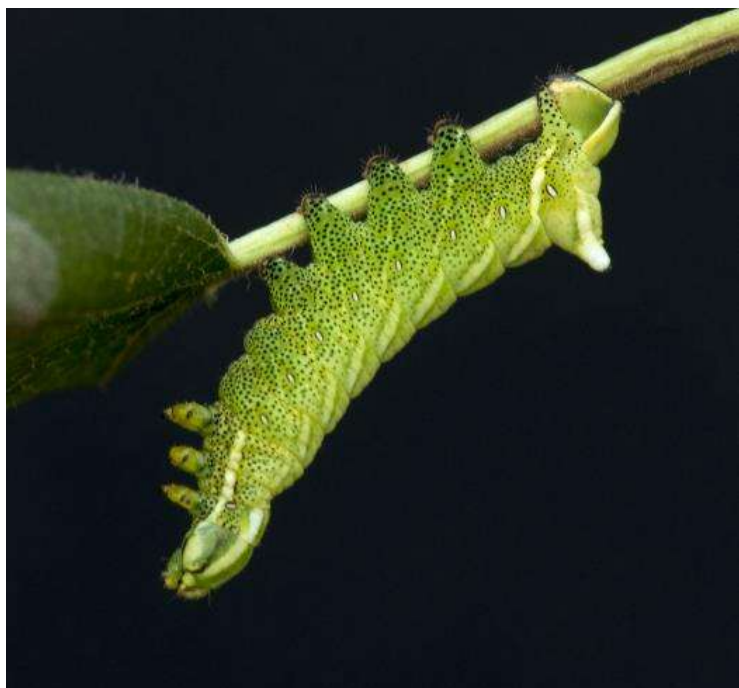
Gevlamde vlinder ( Endromis versicolora ), rups. Hoge Veluwe. (zie pag. 31)