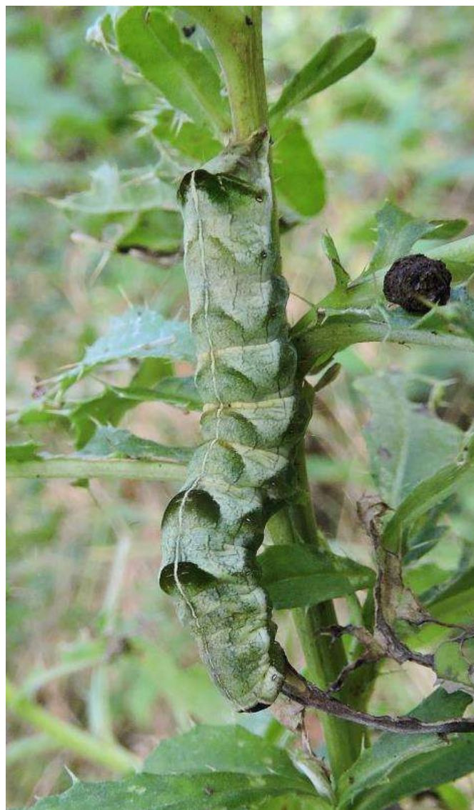
Rups perzikkruiduil ( Melanchnra persicariae ) exc. Fochteloërveen 27 september 2014 Foto: Siep Sinnema (zie pag.20)