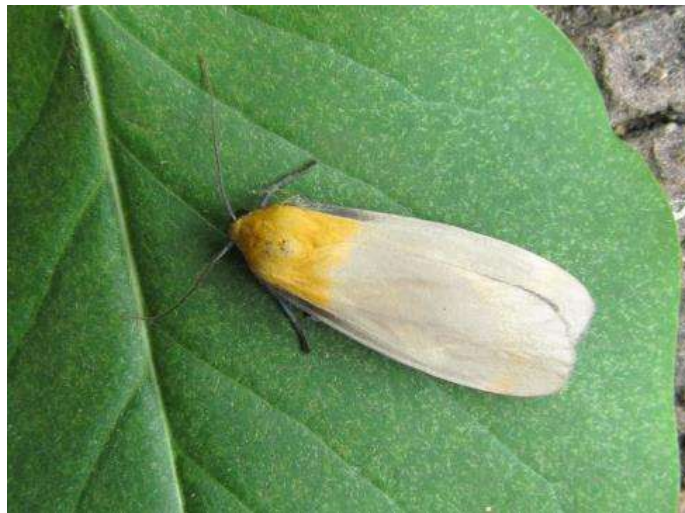
Viervlakvlinder ( Lithosia quadra ) links ♀, rechts ♂ 12 juli 2014 Hemrik (zie pag. 26)