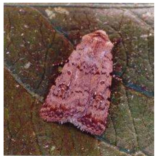
Caridrina clavipalpis huisuil