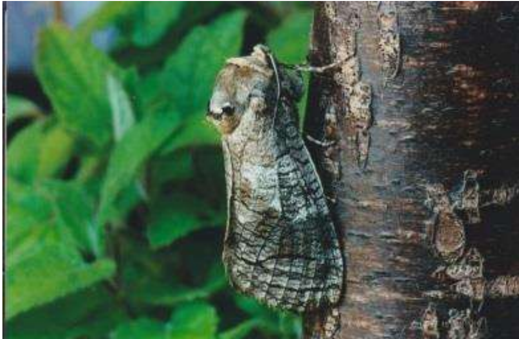
Cossus cossus wilgenhoutrups