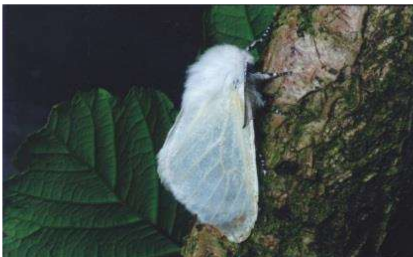
Leucoma salicis satijnvlinder