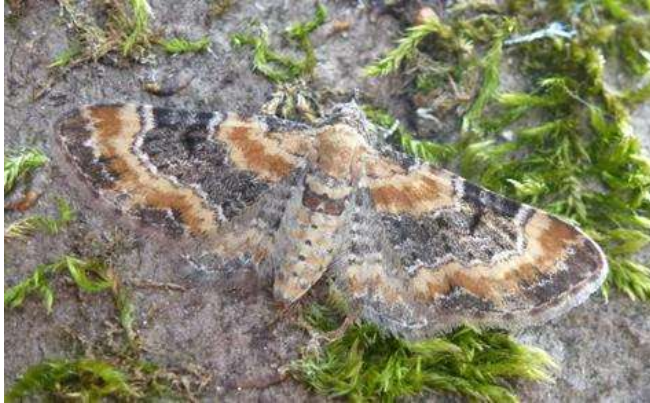
Bij pag. 28: vingerhoedskruiddwergspanner en ( Eupithecia pulchellata ) Oranjewoud.