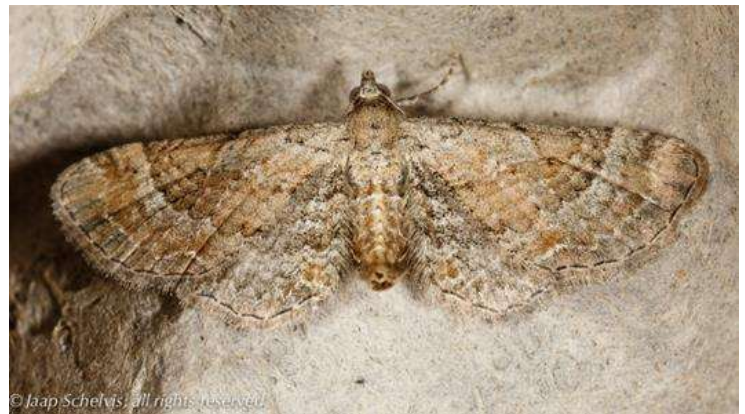
Nog een bijzondere vangst uit 2013: Meldedwergspanner ( Eupithecia simpliciata). Leeuwarden, 12 -08-2013.