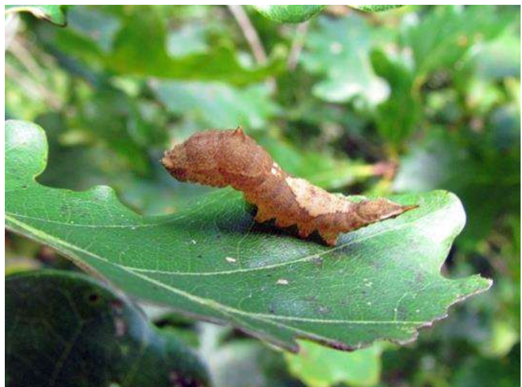
Pag. 15: Watsonalla binaria (Gele eenstaart)