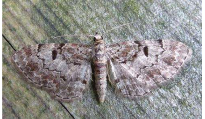
en spardwergspanner ( Eupithecia abietaria), Beetsterzwaag, 05-06-2013.