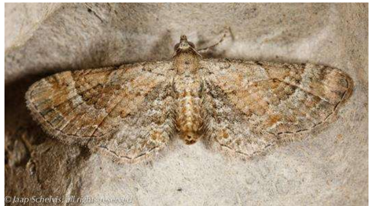
Nog een bijzondere vangst uit 2013: Meldedwergspanner ( Eupithecia simpliciata). Leeuwarden, 12 -08-2013.