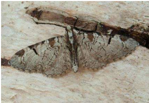
Bij pag. 30: Fruitboomdwergspanner ( Eupithecia insigniata) Opende, 18-05-201