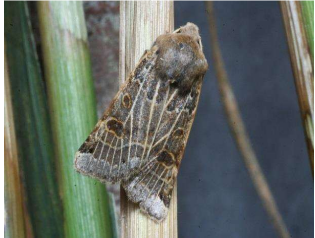
pag. 41: Agrochola lunosa (Maansikkeluil) lichte en donkere vorm.