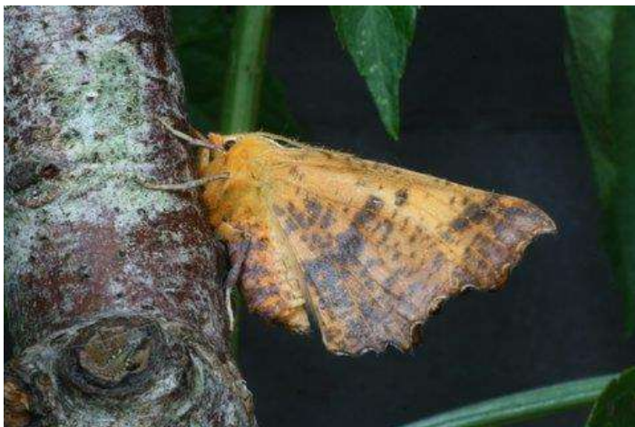
Bij pag. 18: Iepentakvlinder ( Ennonos autumnaria). Oudemirdum, 06-09-2013