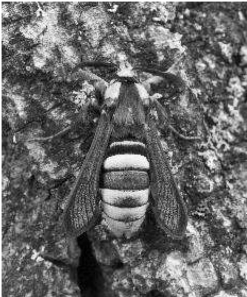
Sesia apiformis (Hoornaarvlinder)

Het was weer een prachtig vlinderjaar voor mij, veel nieuwe dingen gezien en