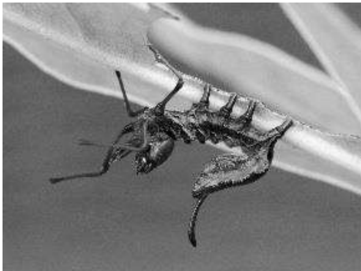
Stauropus fagi (Eekhoorn).

Euthrix potatoria (Rietvink) en de Dryobotodes eremita (Eikenuiltje), waar allemaal na het verpoppen een vlinder uitkwam. Heb ook rupsen via de post