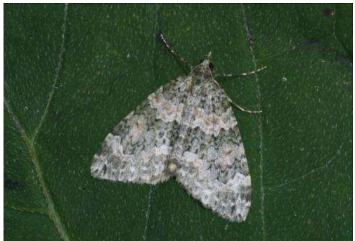
Pag. 41: Chloroclysta miata (Herfstpapegaaitje)