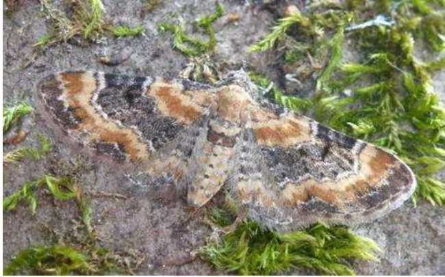
Bij pag. 28: vingerhoedskruiddwergspanner en ( Eupithecia pulchellata ) Oranjewoud.