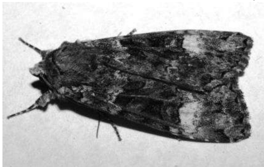
bruine groenuil ( Anaplectoides prasina )

individue was dat het een weinig voorkomende kleurvariatie betrof. Hierdoor was de soort in eerste instantie moeilijk te determineren.