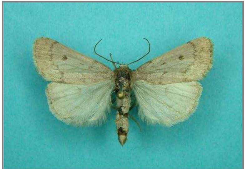
Athetis pallustris (moerasspirea-uil)