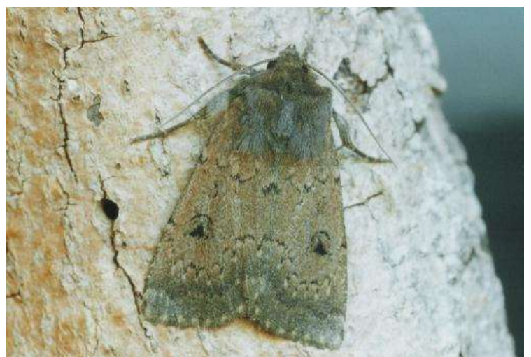
Graphiphora augur (dubbelpijl-uil)