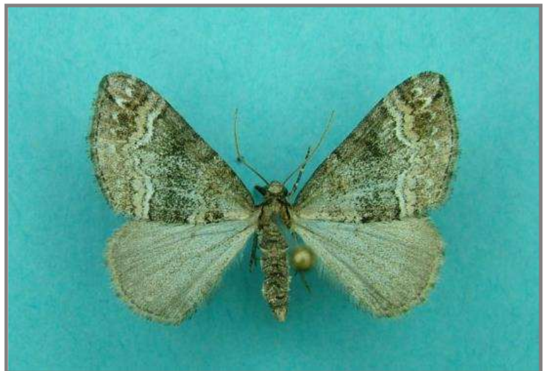
Perizoma bifaciata (donkere ogentroostspanner)