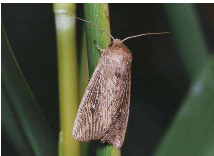
Mythimna obsoleta (gestreepte rietuil)