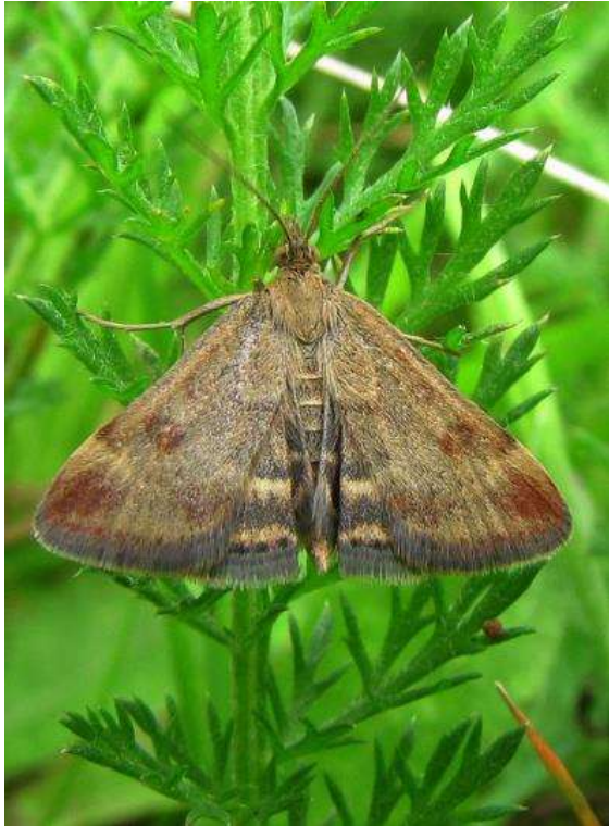
Pyrausta despicata (weegbreemot)