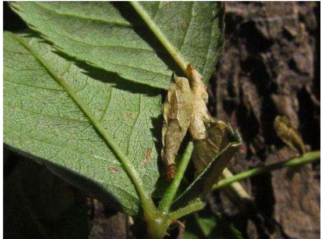
Twee zakjes van het Rozenkoker-motje ( Coleophora gryphipennella ) op Hondstroos tijdens bladmijnenexcursie.