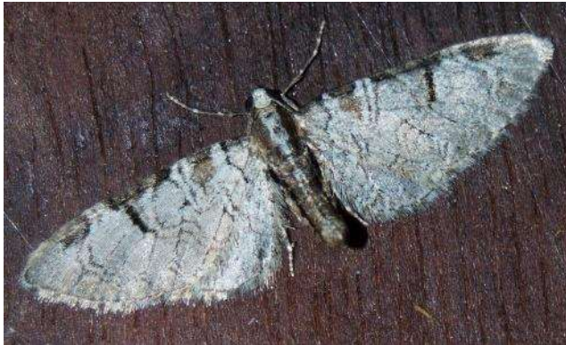
Fruitboomdwergspanner ( Eupithecia insigniata )