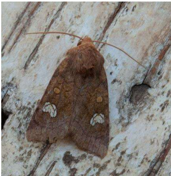
Eikenvoorjaarsuil ( Orthosia miniosa ) Roodbruine vlekkuil ( Amphipoea oculea )