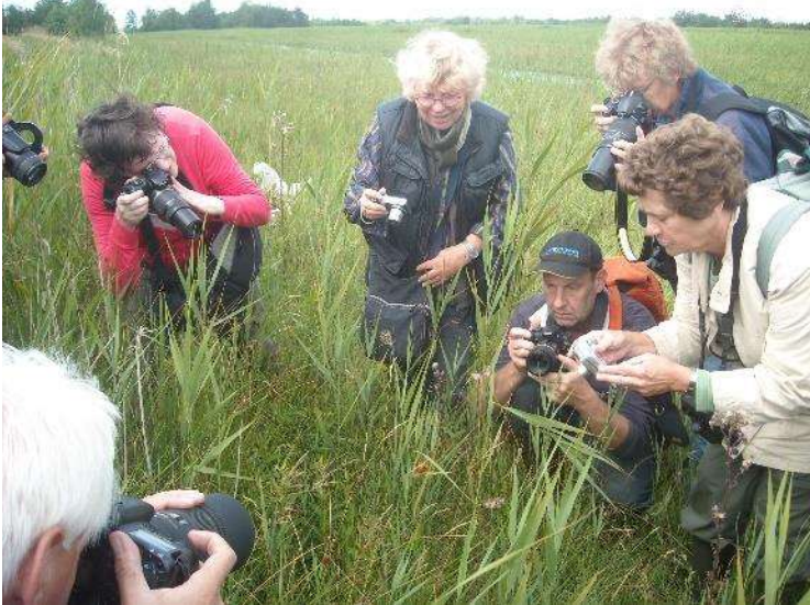
Grote belangstelling van fotografen voor de Grote vuurvlinder (net zichtbaar in het midden) tijdens de excursie in de Rottige Meente.