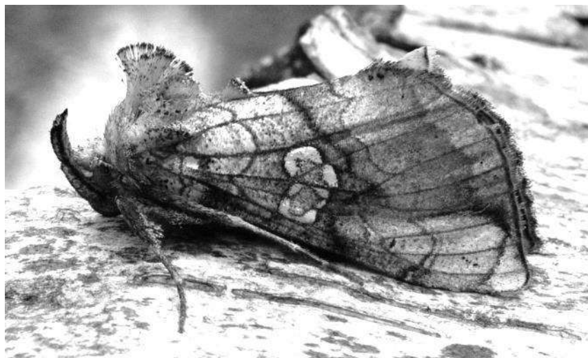
gelduil ( Polychrysis moneta )

querna ), scherphoekbandspanner ( Euphyia unangulata ), eikenvoorjaarsuil ( Orthosia miniosa ), gelduil ( Polychrysis moneta ) en de roodbruine vlekuil ( Amphipoea oculatea ). En dat allemaal, behalve de kommelvlinder, bij ons in de achtertuin!