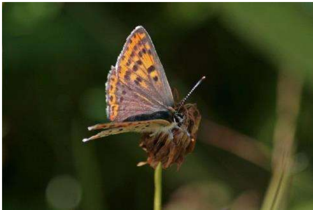
Bruine vuurvliinder ( Lycaena tityrus ), vrouwtje, tijdens de excursie op de Schaapedobbe.