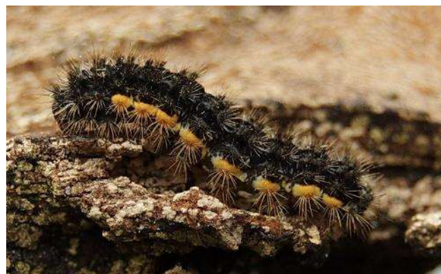
Plat beertje ( Eilema lurideola ) Vlinder en rups