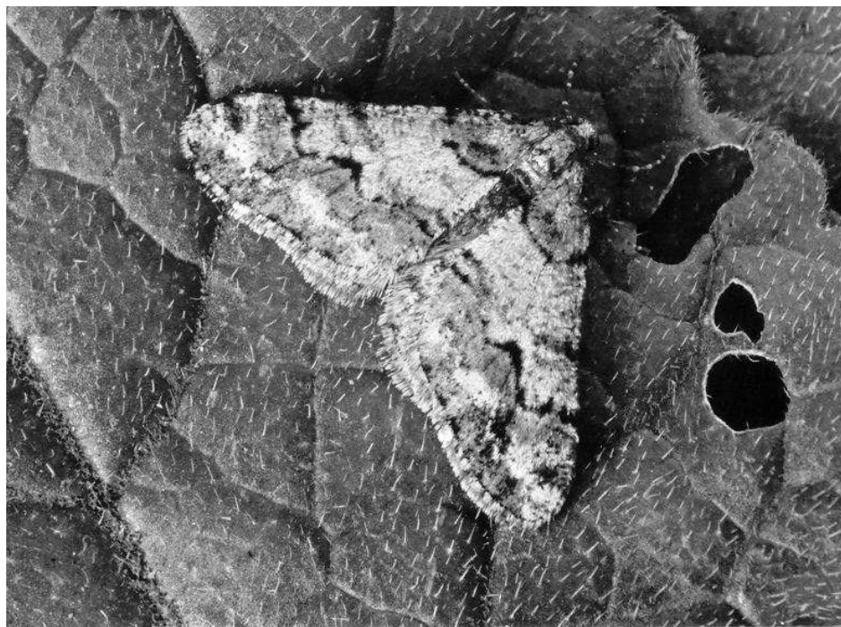
Agriopsis leucophaearia

eik vond ik 126 mannetje's van de soort Agriopsis leucophaearia . Normaal vang ik 20 tot 30 vlinders gedurende het hele voorjaar. De vlinders waren allemaal op de zelfde tijd massaal uit de pop gekomen en op de boomstammen geklommen.