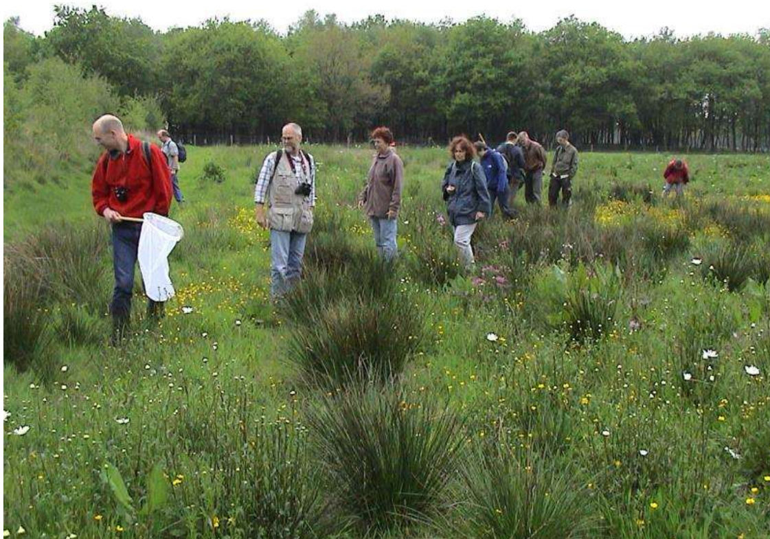
Samen op excursie Excursie VWGF Bakkeveen, mei 2002

Is eenmaal het beeld compleet van wat er in het werkgebied voorkomt, dan is meewerken aan het meetnet vlinders een logische stap. De werkgroepen willen namelijk ook weten hoe het nu met de vlinders gaat. Welke soorten gaan vooruit, welke achteruit en zien we ook verschillen tussen gebieden? Om de leden allemaal zover te krijgen dat ze meewerken is scholing voor veel werkgroepen ook een belangrijke activiteit. Tijdens cursusavonden en excursies wordt kennis overgedragen aan de anderen en zo wordt de groep die effectief mee kan doen aan het onderzoek vergroot. Daarnaast, en dat is misschien nog wel het belangrijkste, zijn die avonden en excursies een sociaal gebeuren en vormen ze een bindende factor.