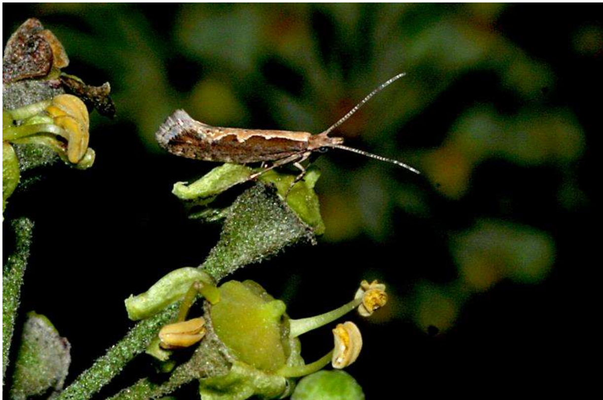
Een van de vele micro's: koolmot ( Plutella xylostella )

Al in de eerste 'Vlinders' in 1986 werd door de Friese vlinderwerkgroep al aangegeven dat er niet alleen naar dagvlinders en macro's zou worden gekeken, maar dat ook (en ik citeer) "... de micro's zullen zeker niet vergeten worden". Daarin is de Vlinderwerkgroep Friesland trouwens tot op de dag van vandaag uniek. Heel incidenteel doet een andere werkgroep wel eens iets aan micro's, maar zeker niet zo intensief als in Friesland.