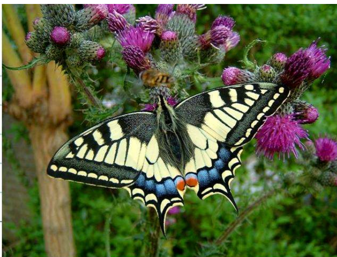
Figuur 7: Gemiddeld aantal koninginnenpages per tuin per provincie