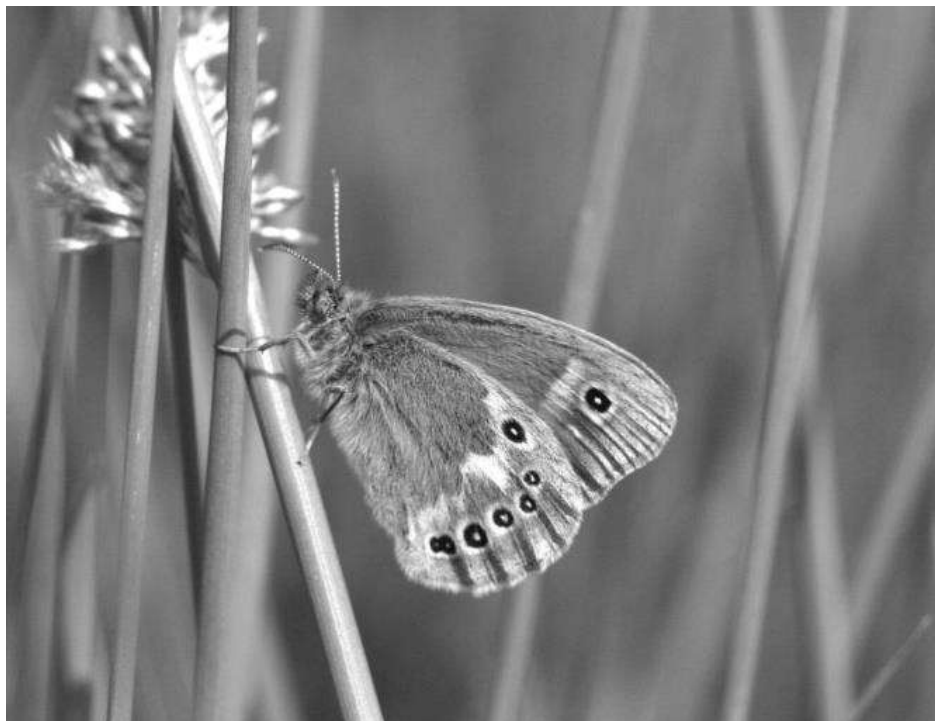
Veenhooibeestje, Coenonympha tulia

De aantallen zijn niet alleen in het Fochteloërveen hoog, maar ook op de andere vliegplaatsen in het noorden van het land. In het veen doet het Wollegras, de waardplant, het ook bijzonder goed.