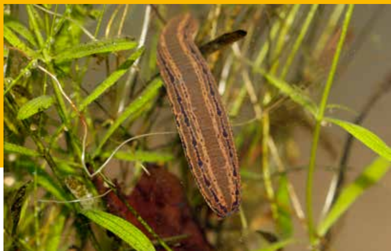
Medicinale bloedzuiger tussen de waterplanten.