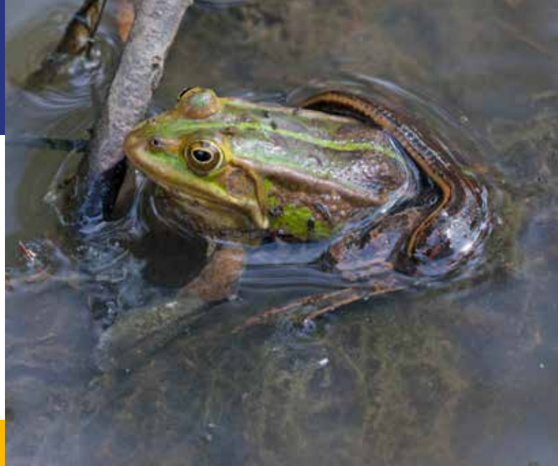
Medicinale bloedzuiger op poelkikker.

De medicinale bloedzuiger is in het verleden in vrijwel alle provincies waargenomen, maar recent alleen nog maar uit enkele (natuur)gebieden in Zuid- en Oost-Nederland (zie kaart). De soort is vermoedelijk sterk afgenomen door verzuring en versnippering. Door verzuring zijn belangrijke gastheren (slakken, amfibieën) sterk afgenomen of verdwenen en door versnippering zijn sommige gebieden vermoedelijk onbereikbaar geworden voor grote zoogdieren. Ook het feit dat vee-drinkpoelen (bijna) niet meer gebruikt worden in de landbouw, draagt vermoedelijk bij aan de afname. Het zwaartepunt van de verspreiding ligt tegenwoordig in het oostelijke rivierengebied. De soort kan zeer oud worden en lang zonder voedsel overleven. Het is goed mogelijk dat de soort nog op meer plekken heeft stand gehouden dan nu bekend. Vooral ondiepe (warme) poelen met flauwe oevers, waterslakken, amfibieën en bereikbaar voor zoogdieren, zijn kansrijke plekken voor de soort.