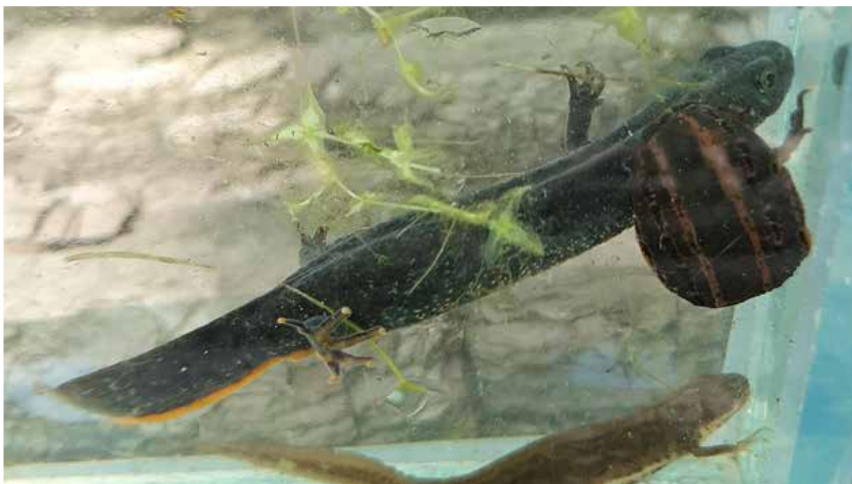
Medicinale bloedzuiger op kamsalamander.

Met een lengte tot 15 cm en een breedte van 10 tot 15 mm is de medicinale bloedzuiger ( Hirudo medicinalis ) de grootste bloedzuiger in Nederland. Ze zijn te herkennen aan de opvallende roodgele lengtestrepen op de groenige rug die door regelmatige zwarte druppelvormige vlekken onderbroken worden. De onderzijde is geelgroen met een variabel patroon van zwarte vlekjes. De soort kan verward worden met de algemeen voorkomende onechte paardenbloedzuiger. Bij deze