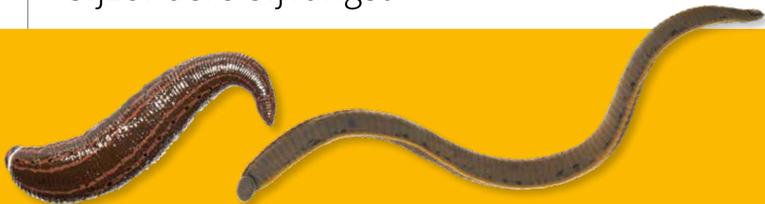
Links medicinale bloedzuiger, rechts onechte paardenbloedzuiger.

Bij amfibieën- en vissenonderzoek wordt regelmatig het schepnet ingezet. Naast de beoogde amfibieën en vissen worden ook andere waterdieren gevangen zoals waterkevers, kreeften, libellenlarven en ook bloedzuigers. Sommige van deze vangsten zijn relatief eenvoudig op naam te brengen en leveren waardevolle gegevens op over de verspreiding van deze soorten. Hier gaan we in op de medicinale bloedzuiger, een zeldzame soort die is opgenomen in bijlage V van de habitatrictlijn.