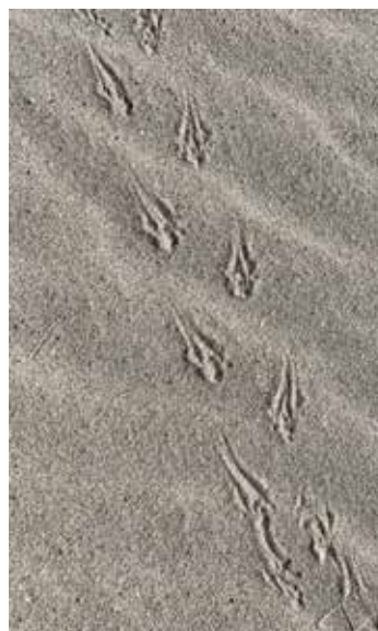
Loopspoor rugstreepad.