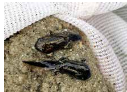
Larven rugstreepad.

de exemplaren die inmiddels al 4 pootjes hebben laten ook een rugstreep zien. Dit keer ook het hele meertje rondgewandeld en niet alleen langs een zijde. Aan de kant waar de wind vandaan kwam lagen ze massaal verscholen bij wat vegetatie. Aan de andere kant spoelden onder andere verzwakte en kleine exemplaren aan, en her en der kom je dwalende enkelingen tegen. Foto gemaakt van het stukje waar de concentratie hoog was, al geeft de foto niet een fantastisch beeld."