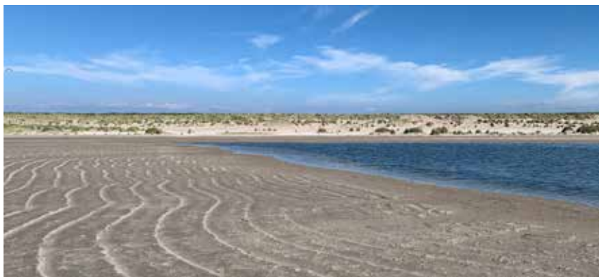
Plasje op de zandmotor.