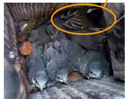
Jonge Koolmees tussen de jonge Boomklevers | Coby Jeninga

Coby: "Elk jaar als de lente voorzichtig aanbreekt, begint het bij mij te kriebelen. Zin om de ladder te pakken en het bos in te gaan. Heel bijzonder dat elke nestkast intussen zijn eigen verhaal heeft. In een van mijn kasten had een Koolmees haar ei in het nest van een Boomklever gelegd. Dat had ik niet gezien (deze eieren lijken best op elkaar), maar toen de jongen een dag of 10 oud waren, zag ik plots een jonge Koolmees tussen de jonge Boomklevers zitten."