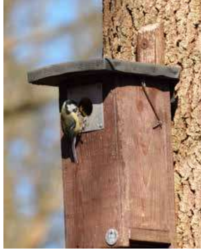
Koolmees bij nestkast

Kortom wil je een keer meelopen of heb je net de ‘vogelherkenningscursus’ gedaan en wil je de ‘vogelherkenning’ uitbreiden... meld je aan! We zien jullie graag komen”.