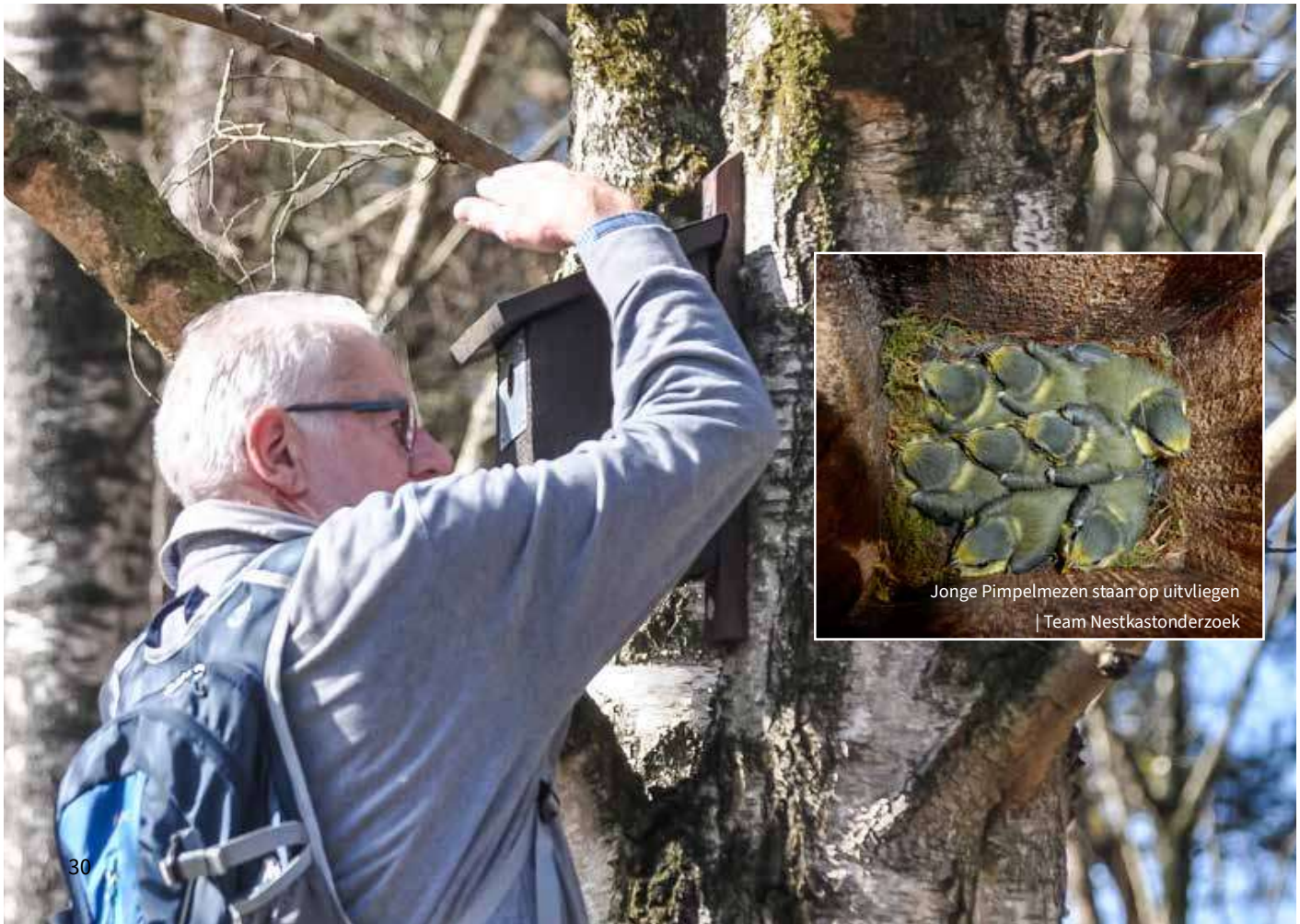
Jonge Pimpelmezen staan op uitvliegen | Team Nestkastonderzoek