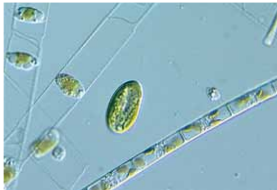
► Cryptomonas te midden van kiezelwieren

Er is alleen ongeslachtelijke voortplanting bekend door simpele deling van een cel.