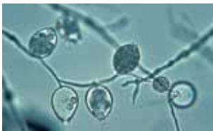
Waterschimmels - Oomycota