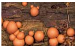
Slijmzwammen - Eumycetozoa