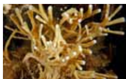
Sponzen - Porifera

later de echte mond gevormd, bij de Deuterostomia ontstaat daaruit de anus en wordt een nieuwe mond gevormd. Het fylum Acoelomorpha, recent afgescheiden van de Platyhelminthes, staat buiten deze twee hoofdgroepen (maar binnen de Bilateria), en de positie van de sterk gereduceerde Mesozoa is onduidelijk.