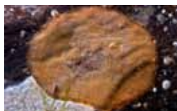
Mosdierjes - Ectoprocta