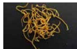
Nematoden - Nematoda