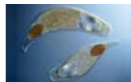
Platwormen - Platyhelminthes