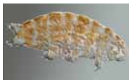
Beerdierjes - Tardigrada