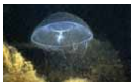
Holtedieren - Cnidaria