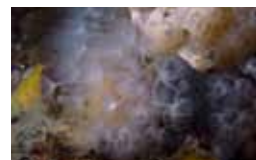
Hoefijzerwormen - Phoronida