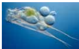
Raderdieren - Syndermata