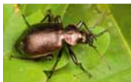
Geleedpotigen - Arthropoda