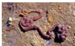
Snoerwormen - Nemertea