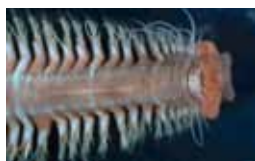
Ringwormen - Annelida