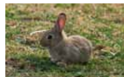
Chordadieren - Chordata