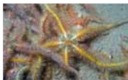
Stekelhuidigen - Echinodermata