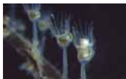
Kelkdierjes - Entoprocta