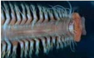
Ringwormen - Annelida