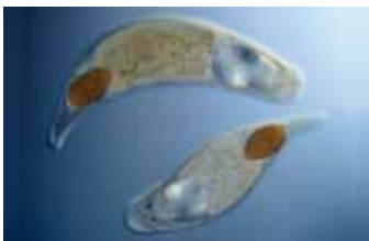
Trilhaarwormen - Turbellaria

echte platwormen (DAWKINS 2004, TYLER ET AL. 2006-2009). Platwormen worden in twee groepen verdeeld: de Catenulida en de Rhabditophora, waartoe alle overige vrijlevende en parasiti-