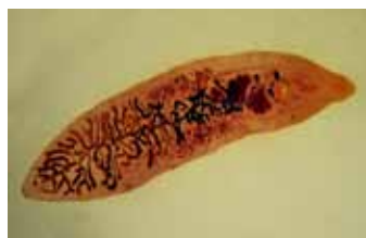
Zuigwormen - Trematoda