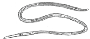
Kaakmondjes - Gnathostomulida