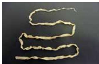
Lintwormen - Cestoda