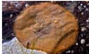
Mosdiertjes - Ectoprocta