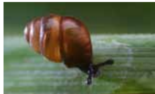
Weekdieren - Mollusca