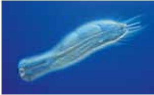
Buikharigen - Gastrotricha