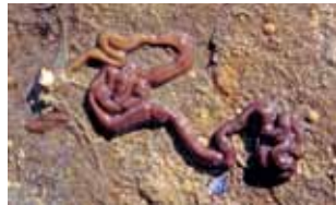
Snoerwormen - Nemertea