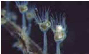
Kelkdiertjes - Entoprocta