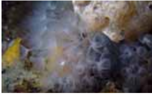
Hoefijzerwormen - Phoronida