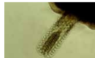
Stekelsnuitwormen - Acanthocephala

Animalia ► Syndermata (fylum) ► 'Rotifera' (subfylum)