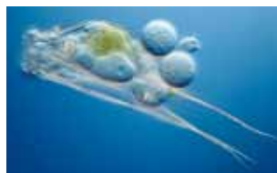
Raderdieren - Rotifera