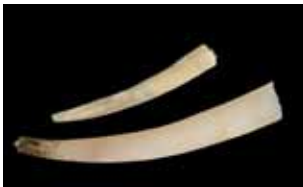
Stoottanden - Scaphopoda