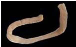
Schildvoetigen - Caudofoveata

NEDERLAND 390 gevestigd (waarvan ruim 80 exoten) WERELD ruim 115.230 beschreven