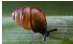
Slakken - Gastropoda