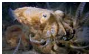
Inktvissen - Cephalopoda