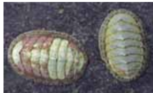
Keverslakken - Polyplacophora