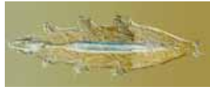
Beerdertjes - Tardigrada