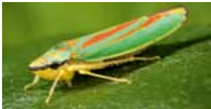
Geleedpotigen - Arthropoda