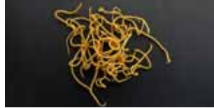
Nematoden - Nematoda