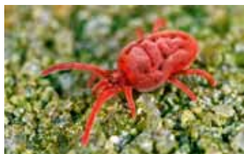
Mijten - Acari