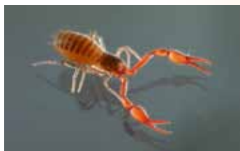
Pseudoscorpionen - Pseudoscorpiones