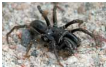
Spinnen - Araneae