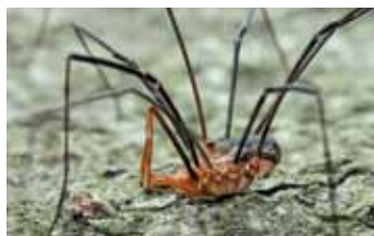
Hooiwagens - Opiliones