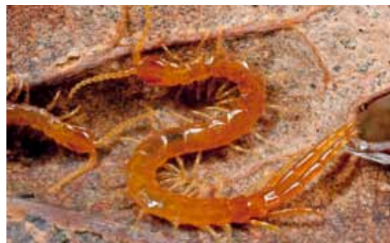
◀◀ Spinduidendpoot Scutigera coleoptrata