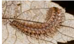
Miljoenpoten - Diplopoda