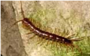
Duizendpoten - Chilopoda

ten (Chilopoda), miljoenpoten (Diplopoda), weinigpoten (Pauropoda) en wortelduizendpoten (Symphyla), die hierna apart behandeld worden. De laatste drie worden wel samengevat als de Progoneata, omdat de geslachtstopping vooraan in het lichaam is geplaatst.