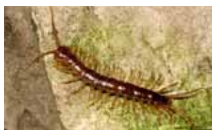
Duizendpoten - Chilopoda

ten (Chilopoda), miljoenpoten (Diplopoda), weinigpoten (Pauropoda) en wortelduizendpoten (Symphyla), die hierna apart behandeld worden. De laatste drie worden wel samengevat als de Progoneata, omdat de geslachtsopening vooraan in het lichaam is geplaatst.