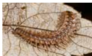
Miljoenpoten - Diplopoda