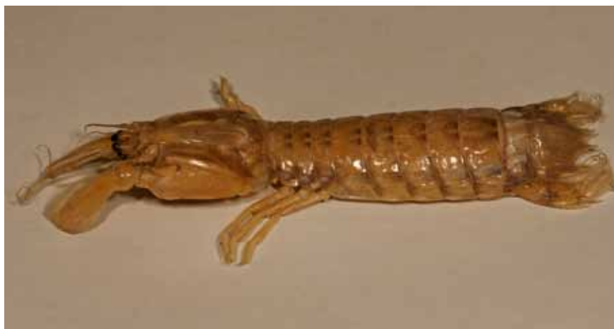
▼ Bidsprinkhaankreeft Rissoides desmaresti