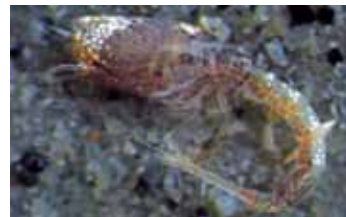
Zeekomma's - Cumacea