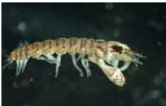
Naaldkreeftjes - Tanaidacea