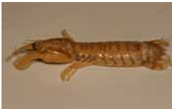
Bidsprinkhaankreeften - Stomatopoda

noemen. In Nederland komen Leptostraca, bidsprinkhaankreeften (Stomatopoda), Bathynellacea, aasgarnalen (Mysida), vlokreeften (Amphipoda), pissebedden (Isopoda), naaldkreeftjes (Tanaidacea), zeekomma's (Cumacea), krill (Euphausiacea) en tienpotigen (Decapoda) voor, die hieronder worden besproken.