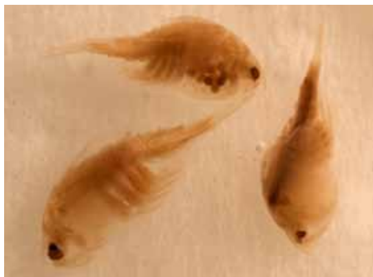
◀ Nebalia bipes

MAUCHLINE 1984, KLUIJVER & INGALSUO 2004.