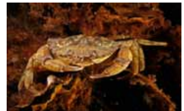
Tienpotigen - Decapoda

Animalia ▶ Arthropoda (fylum) ▶ Pancrustacea (subfylum) ▶ Malacostraca (klasse) ▶ Phyllocarida (subklasse) ▶ Leptostraca (orde)