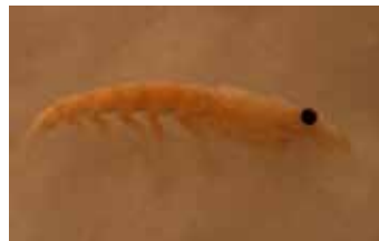
Krill - Euphausiacea