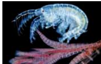
Vlokreeften - Amphipoda