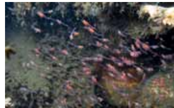
Aasgarnalen - Mysida