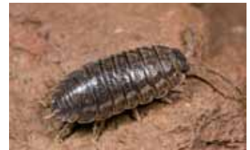
Pissebedden - Isopoda