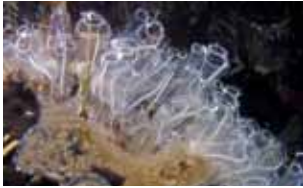
Manteldieren - Tunicata

NEDERLAND 413 gevestigd (waarvan 47 exoten) WERELD 64.733 beschreven