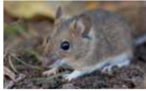
Gewervelde dieren - Vertebrata

Chordadieren hebben, tenminste in het larvale stadium en in de basale groepen, een staart en een notochord of