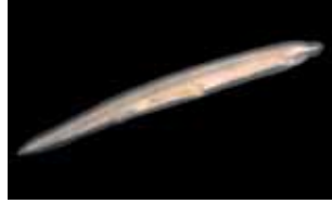
Lancetvisjes - Cephalochordata