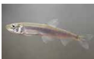
Straalvinnigen - Actinopterygii