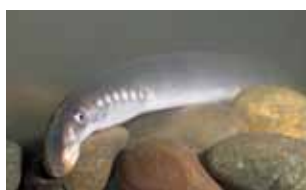
Rondbekken - Cyclostomata