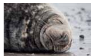
Zoogdieren - Mammalia