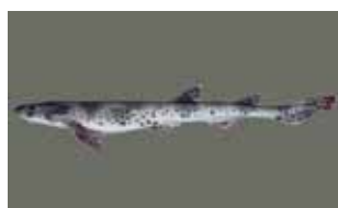
Kraakbeenvissen - Chondrichthyes