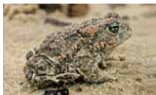
Amfibieën - Lissamphibia