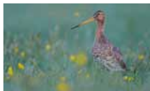
Reptielen en vogels - Reptilia