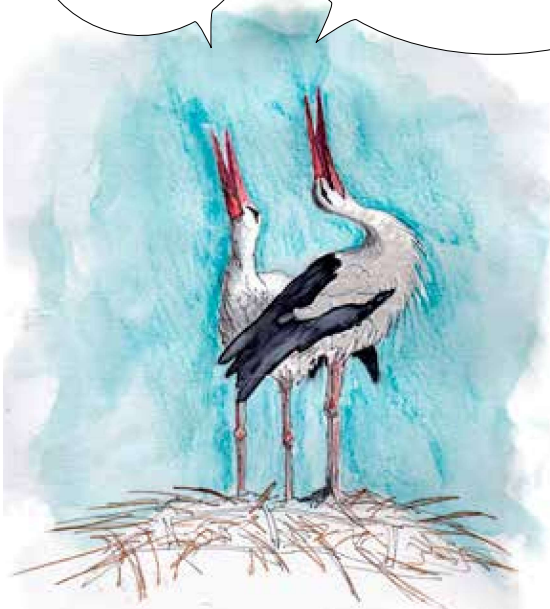
Ooievaars | Gerda Baas

Nee, we blijven dit jaar in Nederland en doen mee aan de landelijke ooievaarstelling op 22 en 23 januari 2022.