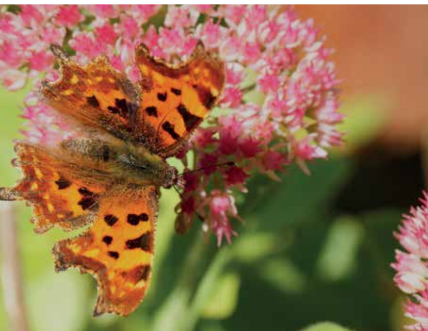
Sedum spectabile met gehakkelde aurelia.

Van Lavandula angustifolia bestaan vele cultivars, waarvan 'Hidcote' en 'Munstead' de bekendste zijn. Volgens kwekerij Bastin zijn er inmiddels betere cultivars dan 'Munstead'. Bijvoorbeeld 'Silver Blue' en 'Royal Blue', die beiden zeer goed winterhard zijn en langer bloeien. De hoogtes verschillen van 40 tot 80 cm, maar ze kunnen nog wel hoger worden als je de onderzijde laat verhouten. Wil je ze kleiner houden, dan kun je ze om de 7 à 10 jaar vervangen.