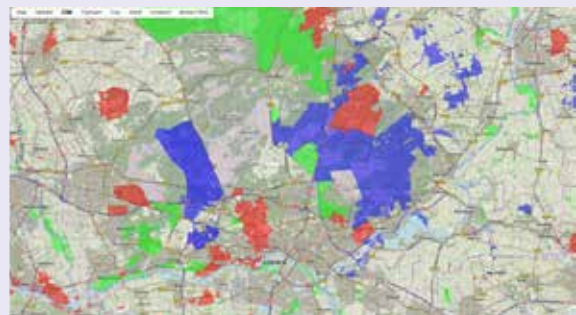
Voorbeeld kaartuitsnede met terreinen van de grote natuurbeheerders. Om een contactpersoon te vinden kun je op een natuurgebied op de kaart klikken.

De ambities zijn om meer en meer via deze site mogelijkheden te realiseren. Houd het in de gaten dus!