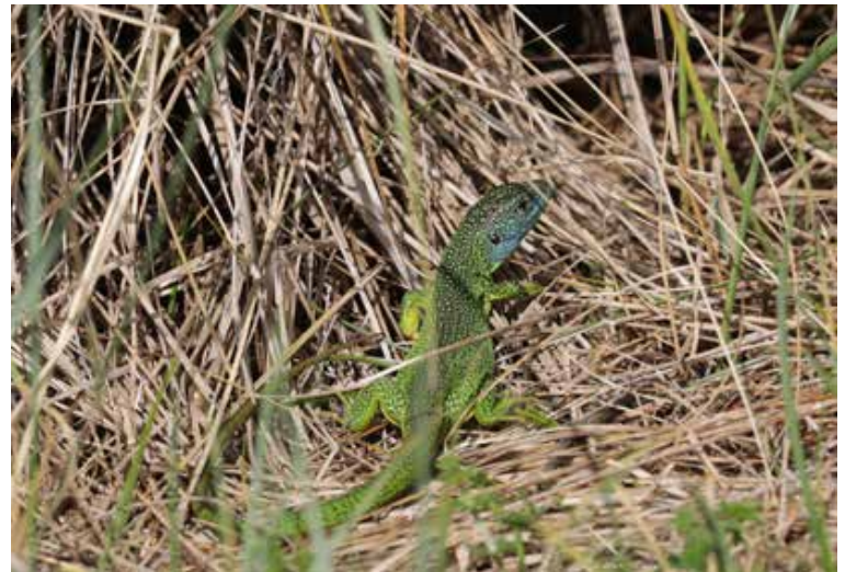
Figuur 4. Man westelijke smaragdhagedis, 2019.

buitenterraria, dus zonder enige vorm van actieve of passieve bijverwarming (Wolterman, 2002; R. Wolterman, pers. med.). Naast het gegeven dat de populatie hier al geruime tijd voorkomt, ondersteunen de genoemde waarnemingen dat er succesvolle voortplanting heeft plaatsgevonden. De kans dat een persoon hier jaarlijks juvenielen uitzet wordt verwaarloosbaar geacht.