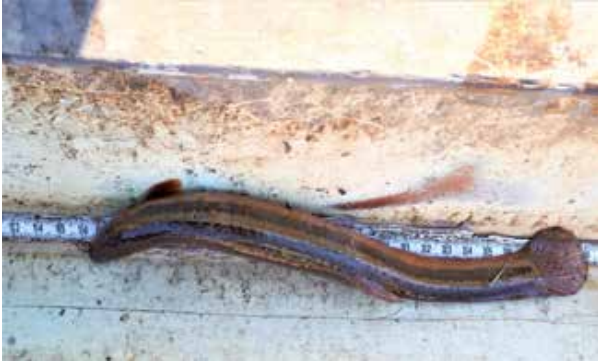
De 25 cm lange grote modderkruiper die op 7 maart 2022 tijdens fuikonderzoek bij gemaal Hongerige Wolf is gevangen.