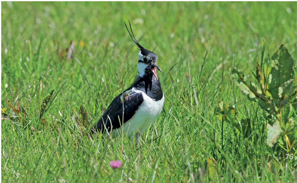
KIEVIT in de Vosse- en Weerlanerpolder.

Ook in onze regio is het aantal broedparen in de laatste 30 jaar sterk teruggelopen. In sommige weidegebieden - waaronder de Verenigde Polders in Schalkwijk en de Hillegomse Oostendorpolder - zijn ze vrijwel geheel verdwenen. Ook de Hekslootpolder is al lang niet meer het weidevogelparadijs