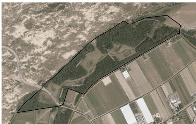
Overzicht BMP plot Vogelaardreef, 30,6 ha